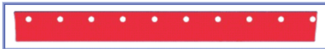
Barra Flexible Porta Puntos

Fabricados en acero SAE 1045 de 6,35 mm. de espesor por 76,2 mm. de ancho. Se entregan en largos de 6000 mm. y 7500 mm.