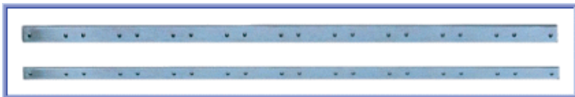
Varilla Porta Secciones (6x25 y 6x19)

Fabricadas en acero SAE 1045 trafilado en sus 4 caras con cantos vivos. Agujeros cónicos que facilitan la extracción de remaches.